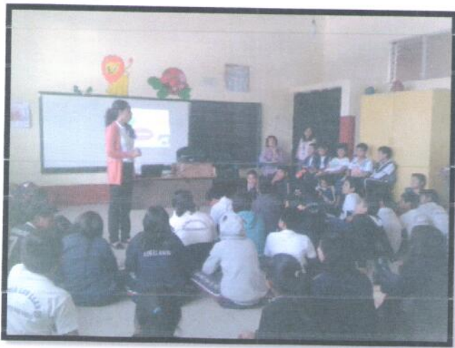
Municipio Jocotenango, Departamento Sacatepéquez. Jornada Matutina. EOUM Dr. Víctor Manuel Asturias Castañeda.