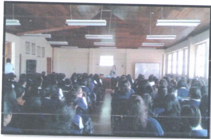
Municipio Antigua Guatemala, Departamento Sacatepéquez. Jornada Matutina. INEB Adscrito al Instituto Normal para Señoritas " Olimpia Leal"