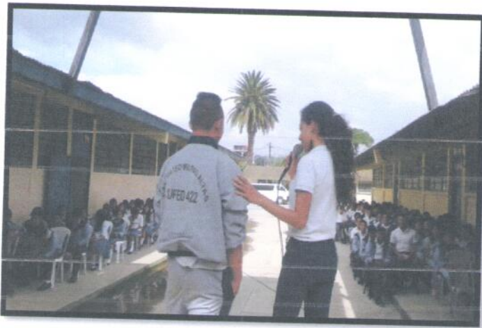
Municipio Antigua Guatemala, Departamento Sacatepéquez. Jornada Vespertina. NUFED No. 422