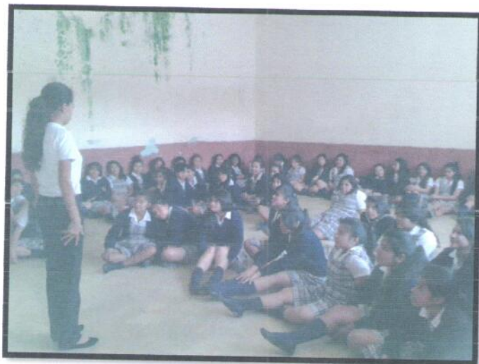
Departamento Guatemala. Jornada Matutina. INEB Maria Luisa Samayoa Lanuza.