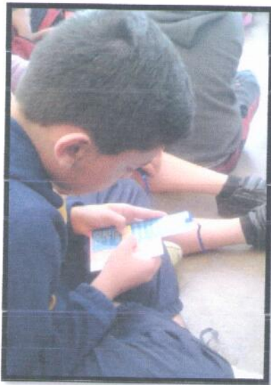
Municipio Antigua Guatemala. Departamento Sacatepéquez. Jornada Matutina. EOUV Mariano Navarrete.