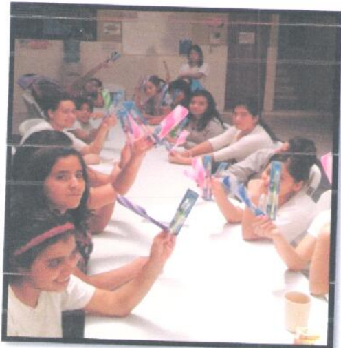
Albergue SVET, Departamento de Guatemala. Charla sobre hábitos de higiene.