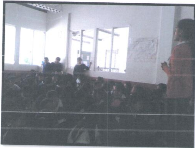
Municipio Pastores, Departamento Sacatepéquez. Jornada Matutina. EORM Aldea San Lorenzo el Tejar.